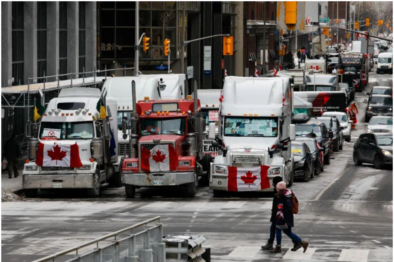
2022年2月16日，加拿大卡车司机围堵了首都渥太华中心区域，抗议政府出台的新冠疫苗强制令。