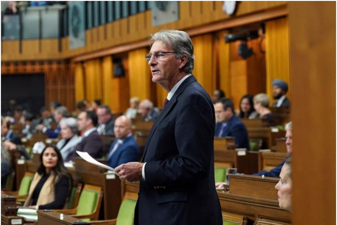
下议院国防委员会主席马凯 (John McKay)

继去年十月加拿大下议院国贸委员会主席史葛洛 (Judy Sgro) 等共五名下议员窜访台湾地区后，加拿大下议院跨党派议员共十人于 4 月 10 日起窜访台湾地区。值得注意的是，过去窜访台湾地区的加拿大议员都是以经贸和文化交流为主，这是首度将国安和外交议题列为主轴。