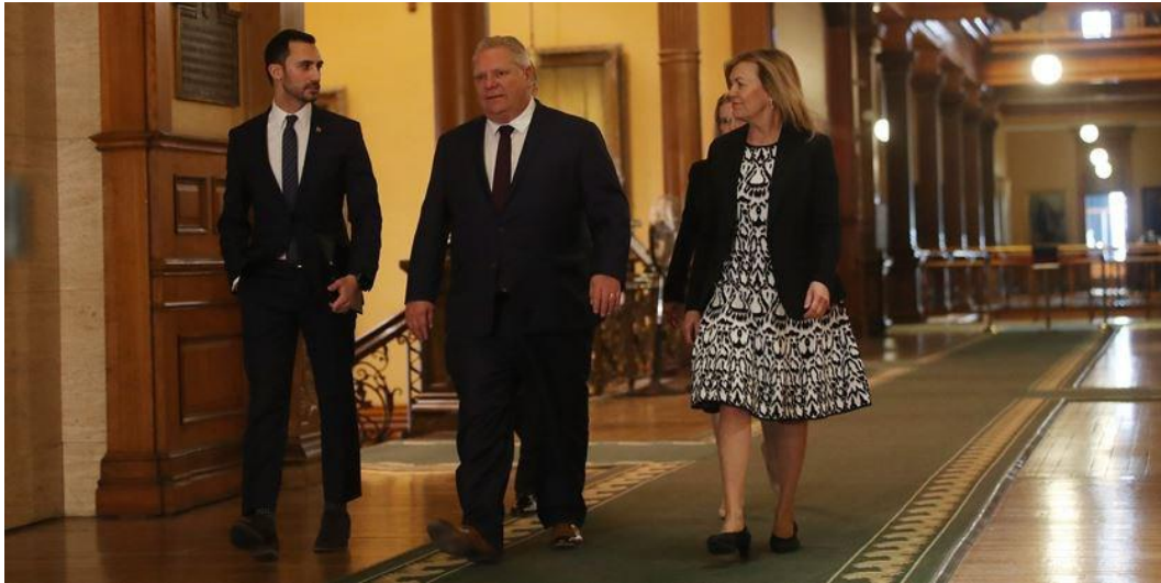
图 2：各省领导人会面磋商

安省省长福特(Doug Ford)表示，将允许少数几家季节性企业在 5 月 4 日重新开业，例如，有路边接送服务的花园中心、草坪护理和景观美化公司，以及自动洗车服务，但是所有人都必须保持社交距离。