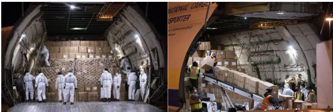
图 5：来自中国的个人防护物资抵达魁北克

1. 5月2日，世界上最大的运输机 Antonov AN-225 Mriya（简称安-255）满载从中国采购的个人防护装备抵达魁北克省米拉贝尔机场（Mirabel Airport）。