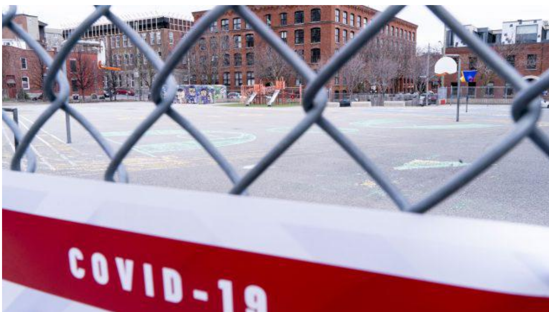
图 3：因疫情封闭的活动场所

魁省省长弗朗索瓦·莱戈(Francois Legault)表示，5 月 11 日，将重新开放除蒙特利尔以外的学校和托儿所。但是高中、初级学院以及大学在 9 月之前都将继续保持关闭状态。除蒙特利尔外，魁省所有的零售店于 5 月 4 日重新开业，蒙特利尔的零售店将于 5 月 11 日恢复营业。建筑与制造企业将于 5 月 11 日恢复运营，但是必须对每班工作的员工人数进行初步限制。