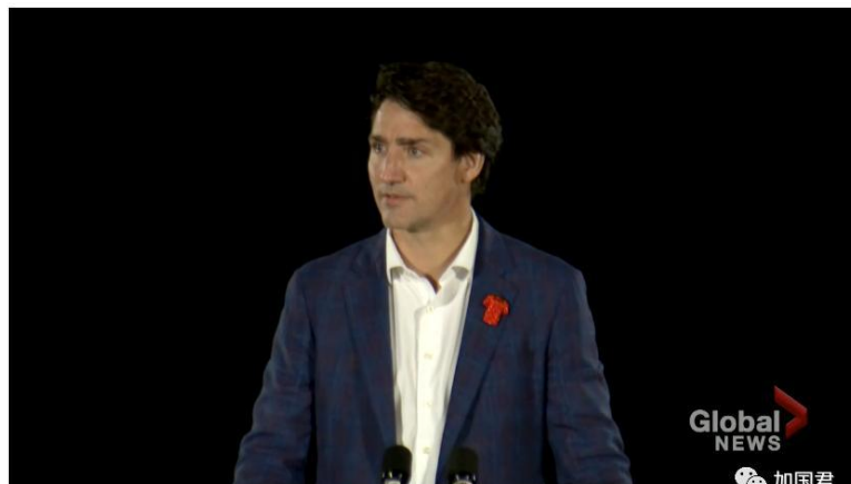
WATCH: 'Listen to the stories of survivors' as we mark National Day of Truth and Reconciliation, Trudeau says

By Mercedes Stephenson & Rachel Gilmore · Global News Posted September 30, 2021 3:49 pm · Updated September 30, 2021 3:51 pm