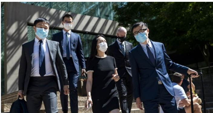
当地时间2021年8月12日，加拿大不列颠哥伦比亚省温哥华，孟晚舟女士出席引渡案听证会。孟晚舟引渡案从8月11日开始进入“引渡递解”的审理，法庭将就检方提出的要求引渡的理由进行辩论。

加拿大检方称孟晚舟向汇丰隐瞒了做伊朗生意的公司和华为的关系，而孟晚舟方面则称已经说明，是汇丰不当操作造成违反美国法律